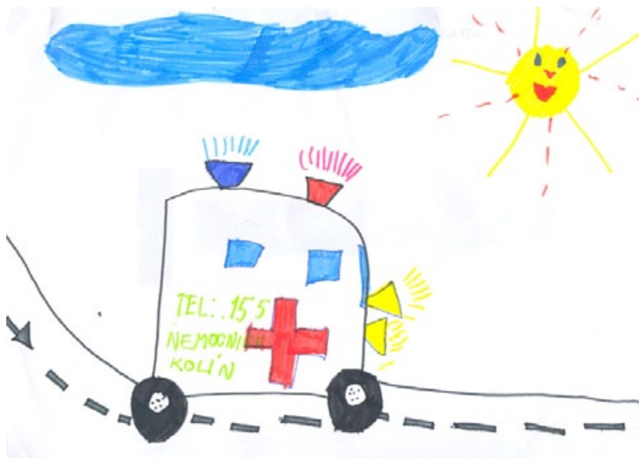
L. Smetanová, 2.A

Hlavně nesmí ohrozit samy sebe! Mnohdy stačí, když se snaží raněného alespoň slovně uklidnit, bavit se s ním. Je opravdu těžké někomu pomoci, když k tomu nemám žádné pomůcky, bojím se, abych neublížila ještě více. Je dobré, aby děti věděly, co dělat, aby nezapadl jazyk nebo jak se staví krvácení. Mnohdy stačí vědět alespoň to, na jaké číslo zavolat. Určitě všichni víte, že hasiči mají linku 150, záchranná služba 155 a policie 158.