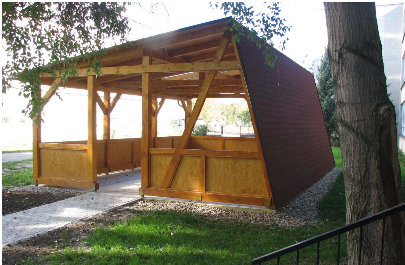
Nový altán bude sloužit jako venkovní učebna.