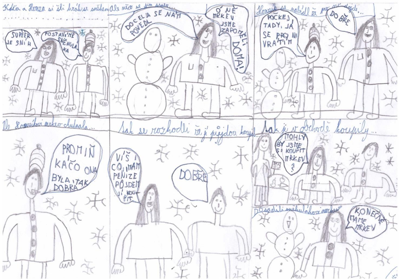
Cháma, IV, B