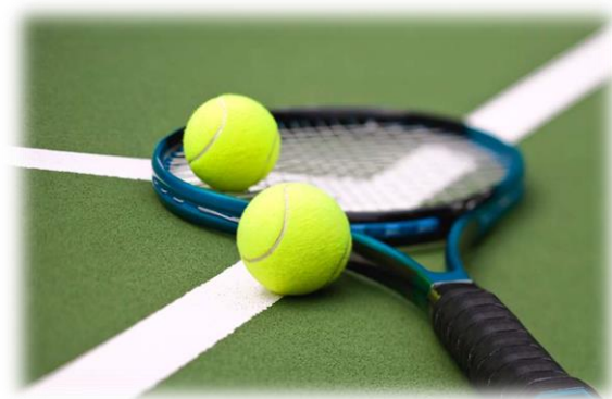
Nela Kadlecová 8. B