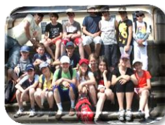
Počet tříd celkem

Tato zpráva shrnuje práci ve školním roce 2010/2011. Byla projednána na pedagogické radě dne 1.9. 2011.